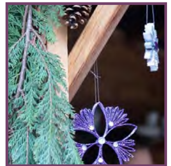
Upcycling: Wunderschöne Weihnachtssterne aus Küchenkrepp