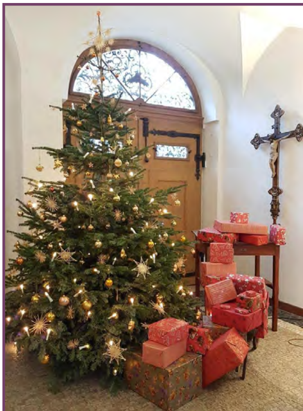
Der Weihnachtsbaum in der Halle vor unserer Hauskapelle (Vincentinum)