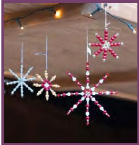
Sterne aus Krepp, Papier oder Perlen: Für jeden Deko-Geschmack war etwas dabei

Newsletter der Vinzenz-Konferenzen in der Erzdiözese München und Freising Januar 2019