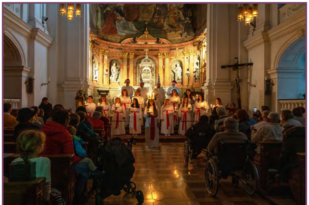
Eines der Highlights: Die Luciafeier mit dem schwedischen Chor The Scandinavian Ensemble in der Hauskapelle des Vincentinums